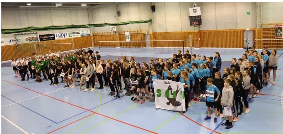
Fram cup 2020. Deltakarane får informasjon om dagen.