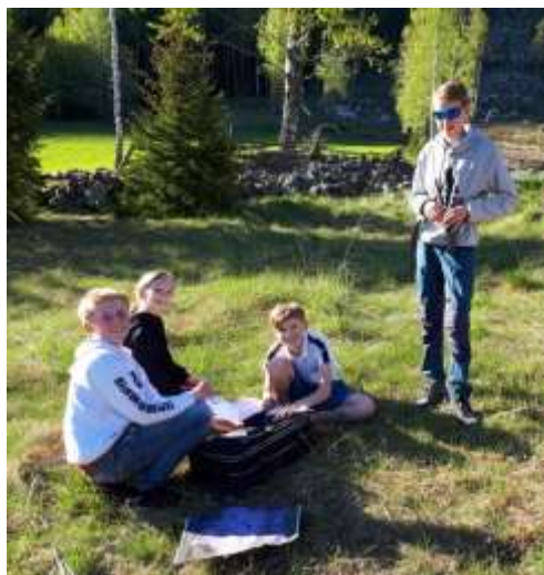
Aktivitetssmøte i Rotneim 4H

Årsmeldingene til klubbene viser god aktivitet til tross for at flere klubbmøter måtte avlyses pga. restriksjoner i forhold til å kunne samle folk. Klubbene har dette året hatt de fleste møtene sine utendørs, og flere har også fått opprettholdt den faste volleyballtreninger deler av året. Det jobbes med rekruttering på lokalplan hele året, men vi må bli enda flinkere til å vise fram alle de gode aktivitetene 4H har å by på.