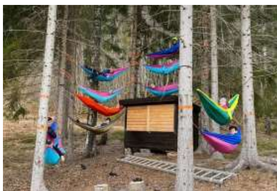
Friluftsheltkurset under Styrevervskurset

Arrangører: BASE, 4H Buskerud og Vittingen 4H