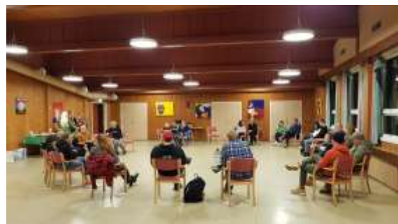
Kryllingen 4H, under sin koronavennlige høstfest

Klubben som hadde jubileum, mottok en oppmerksomhet fra 4H Buskerud.