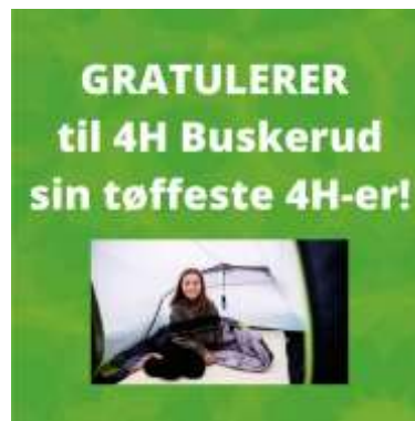
Vita Lover fra Hallingen 4H sov ute hver natt mellom 1.mai og 1. oktober, hele 153 netter, og vant utfordringen under Sov ute med 4H Buskerud

I tillegg hadde vi en utfordring om hvem som sov ute flest netter mellom 1.mai og 1. oktober. I denne utfordringen deltok 23 stykker.