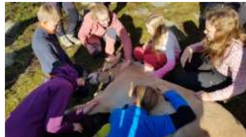
Hestekos på Langedrag