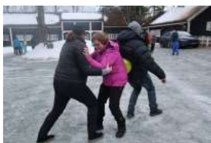
Uteaktivitet på klubbrådgiversamlingen