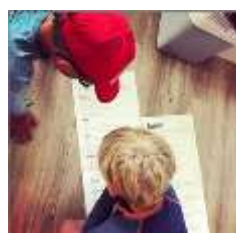
Kløvermedlemmene koste seg med Leir i konvolutt.