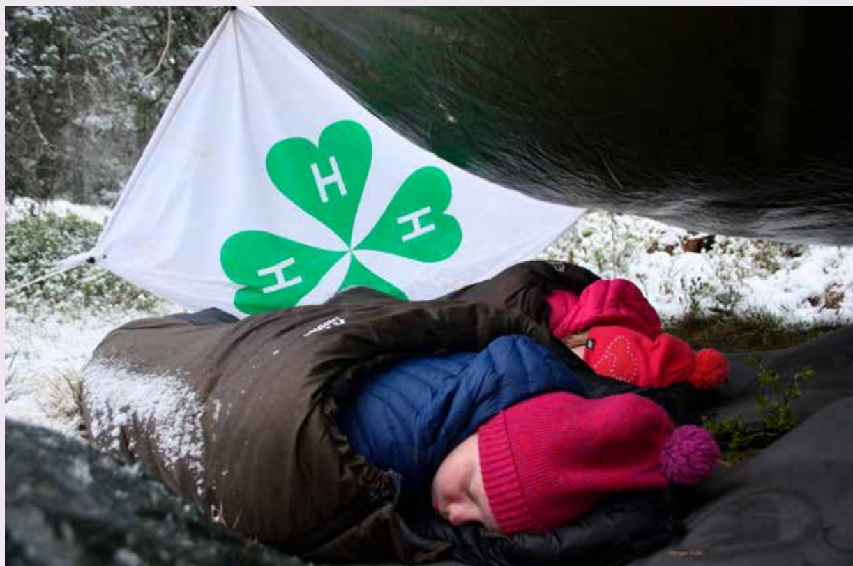
Under open himmel blei markert i samband med 4H-dagen 4. mai. 4H-arar over heile landet markerte dagen med å sove ute under open himmel.