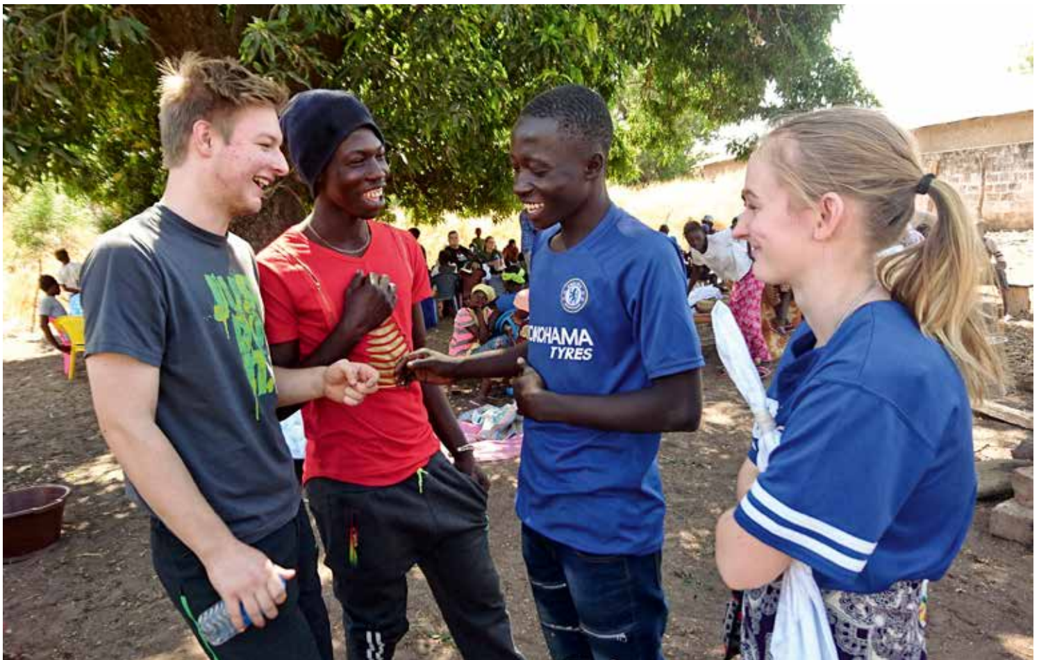
▲ Anna kvart år kan 4H-arar delta på studietur til 4H i Gambia.