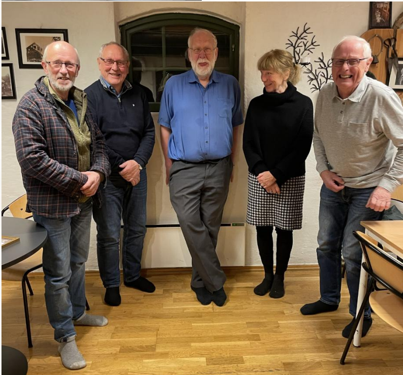
Denne glade gjengen tok plaketten på 60- og 70-tallet, og møttes fremdeles for å mimre om gode øyeblikk fra tiden i Freidig 4H-klubb.