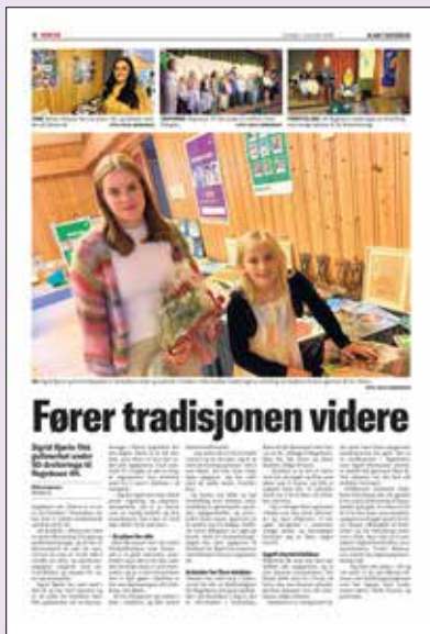
02.11.23 Bladet Vesterålen