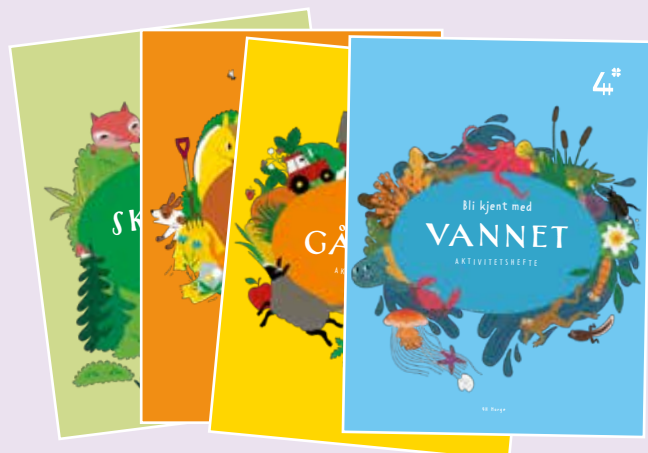
Aktivitetshettet for kløvermedlemmar (4–9 år).

For fjerde år på rad vart det laga eit aktivitetshefte, spesielt for våre yngste medlemmar (4–9 år); kløvermedlemmane. Heftet skal inspirere til og legge til rette for lek og læring i og med naturen, i tillegg til å skape kjennskap til eit emne, gjennom å skape nysgjerrigheit. Dette var fjerde av fem planlagde hefter. Temaet var vatn. Tidlegare har det vore gitt ut hefter om skogen, dyra og garden, medan planter er det gjenværande temaet.