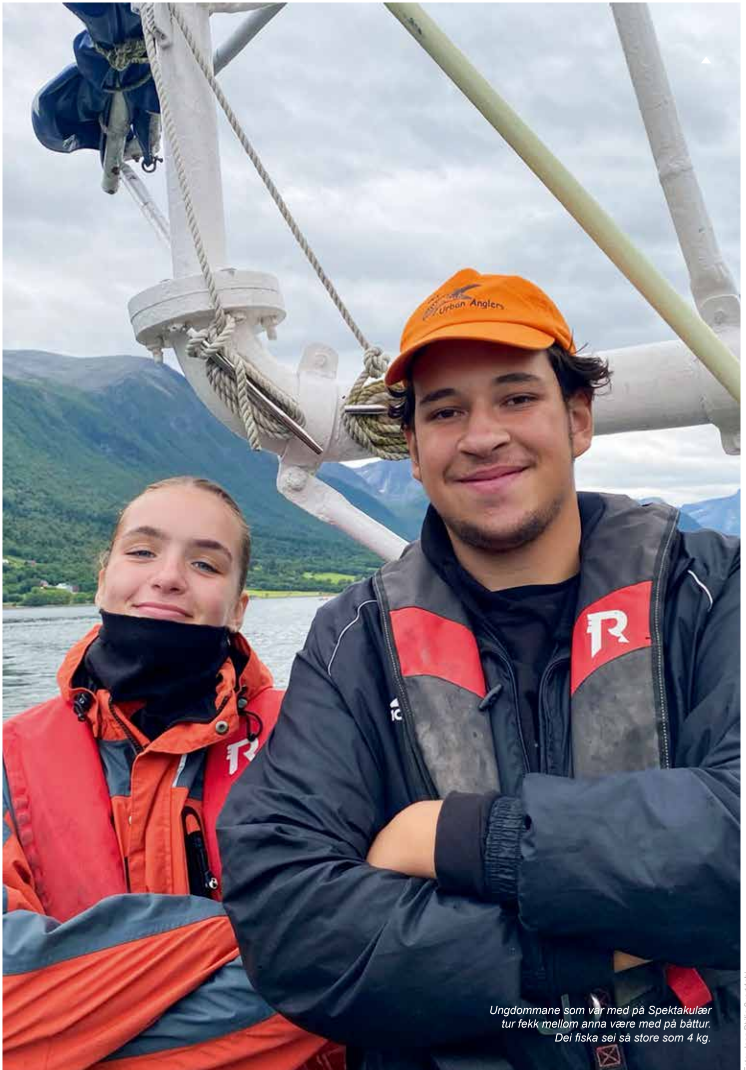
Ungdommane som var med på Spektakulær tur fekk mellom anna være med på båttur. Dei fiska sei så store som 4 kg.