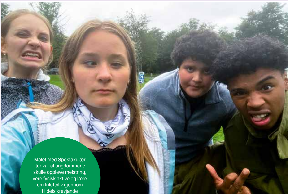
Foto: selfie tatt av 4H-arar

Målet med Spektakulær tur var at ungdommane skulle oppleve meistring, vere fysisk aktive og lære om friluftsliv gjennom til dels krevjande friluftslivsaktivitetar.