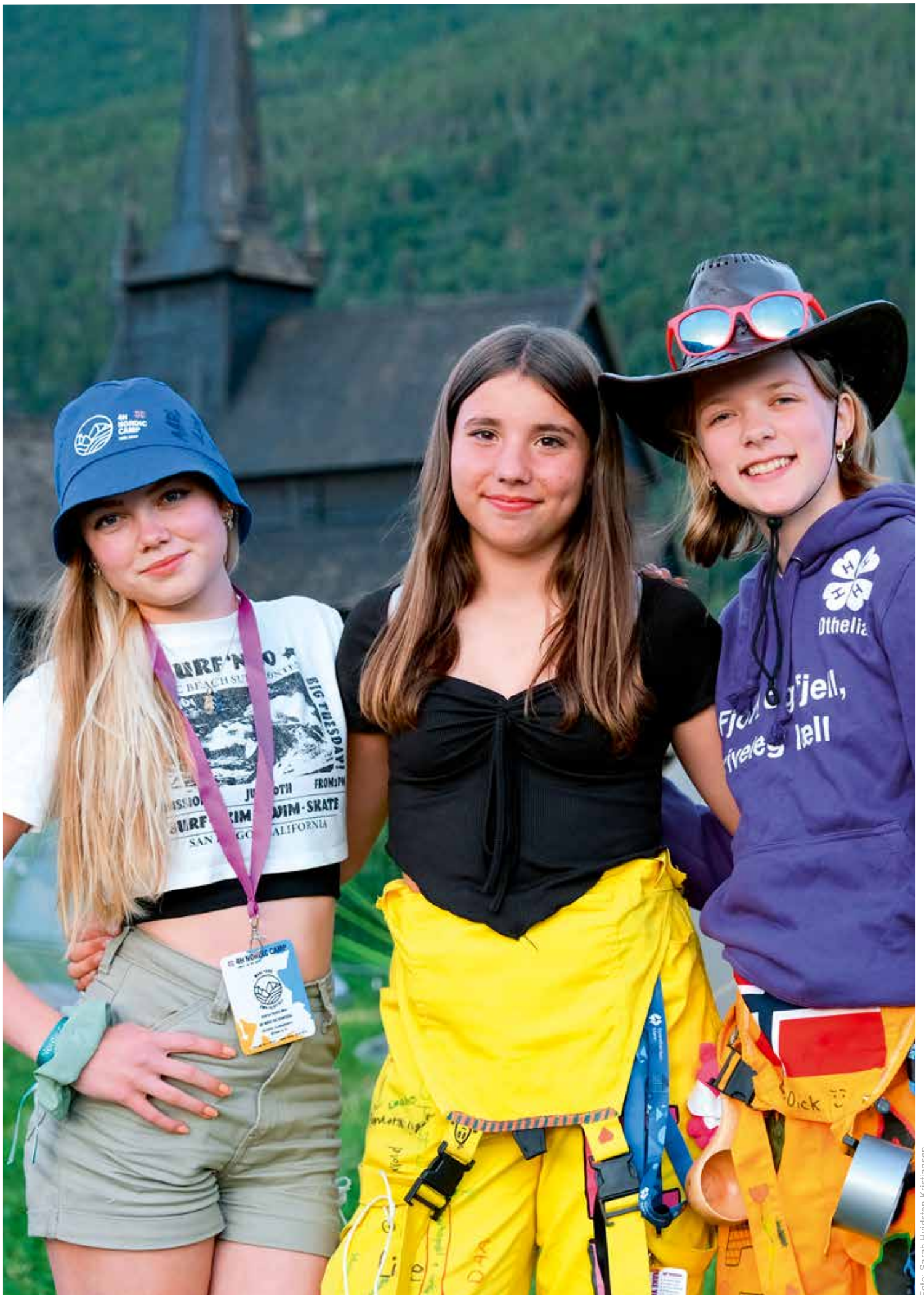
▲ 4H-arar på leircamp på Nordisk leir i Lom. (Lom stavkyrkje i bakgrunnen).