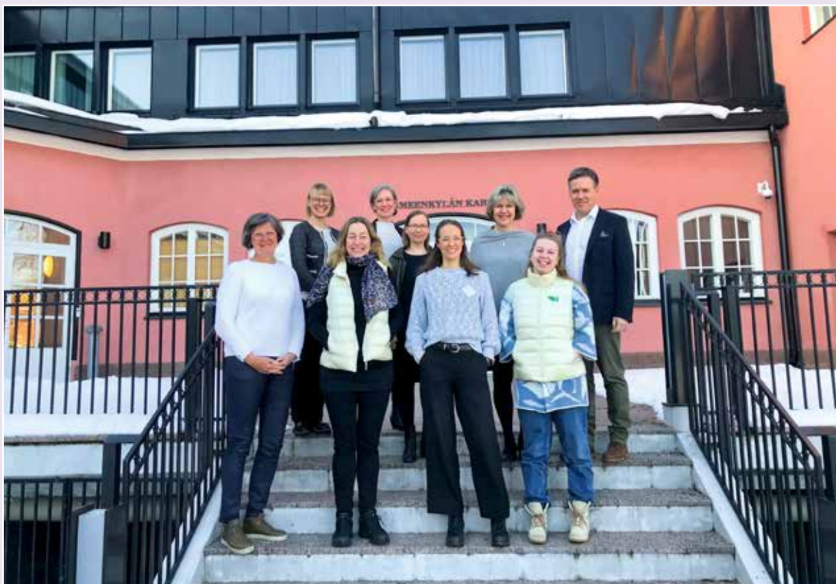
▲ Generalsekretærer frå dei Nordiske landa møttest i Helsinki der dei la planer for framtidig samarbeid.