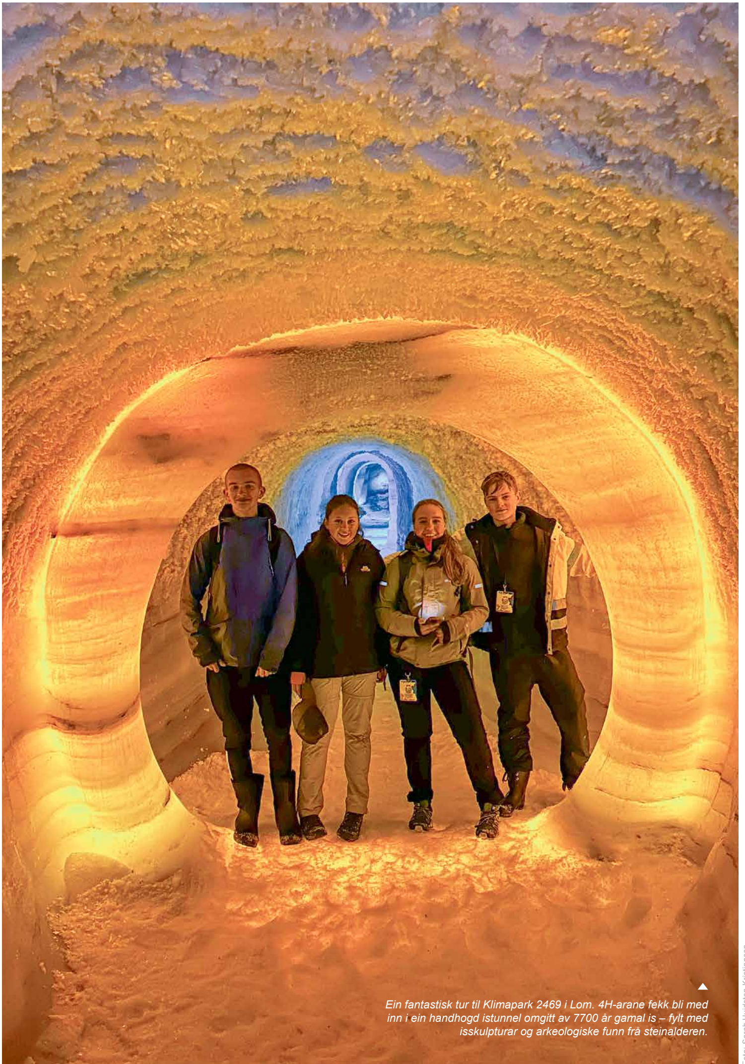
Ein fantastisk tur til Klimapark 2469 i Lom. 4H-arane fekk bli med inn i ein handhogd istunnel omgitt av 7700 år gamal is – fylt med isskulpturar og arkeologiske funn frå steinalderen.