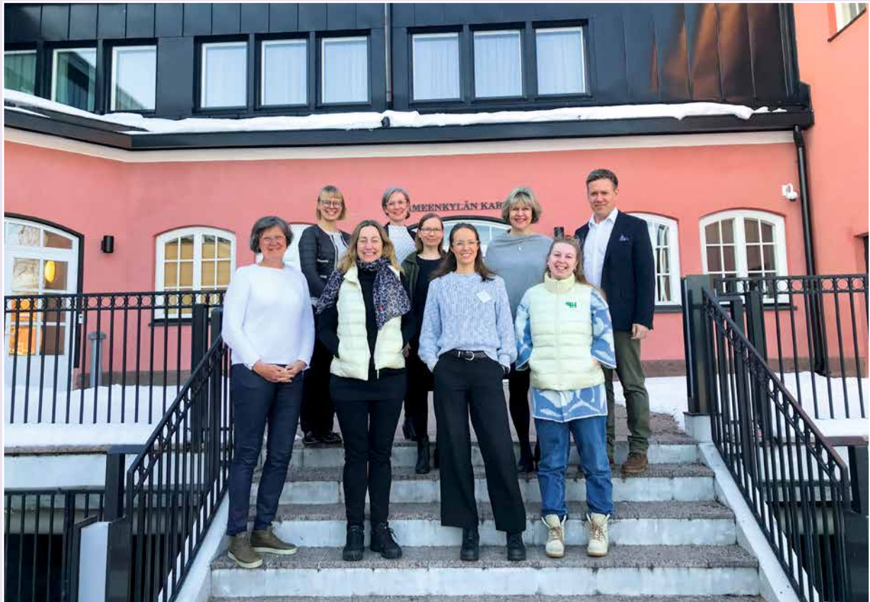
▲ Generalsekretærer frå dei Nordiske landa møttest i Helsinki der dei la planer for framtidig samarbeid.