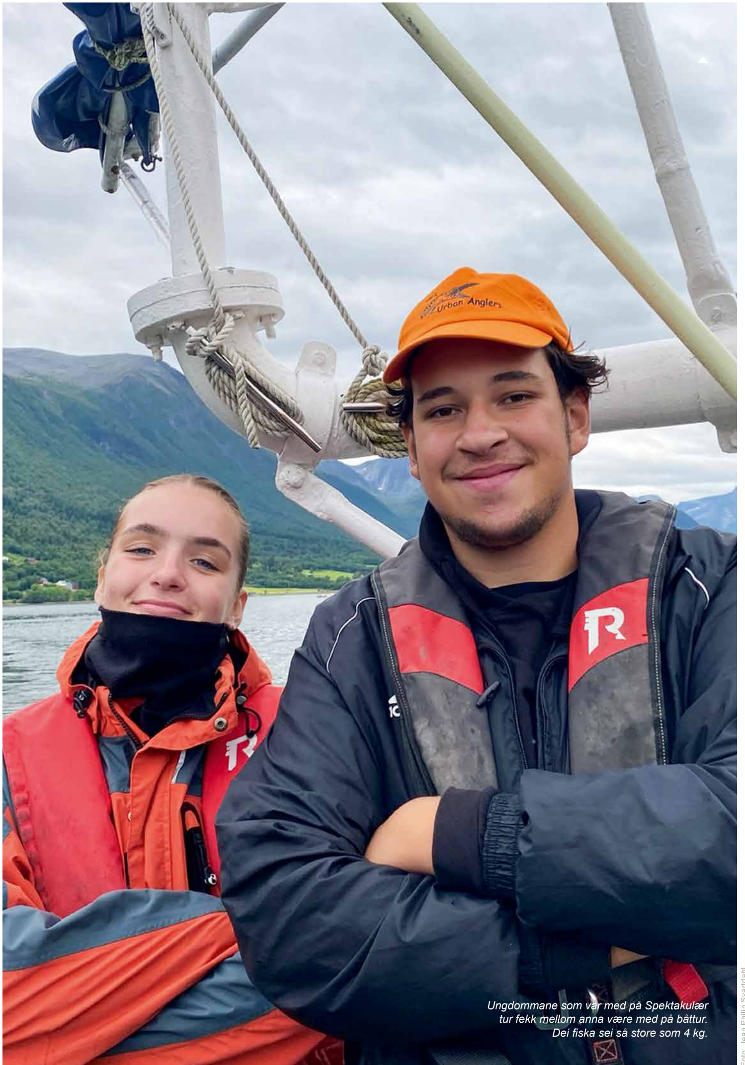
Ungdommane som var med på Spektakulær tur fekk mellom anna være med på båttur. Dei fiska sei så store som 4 kg.