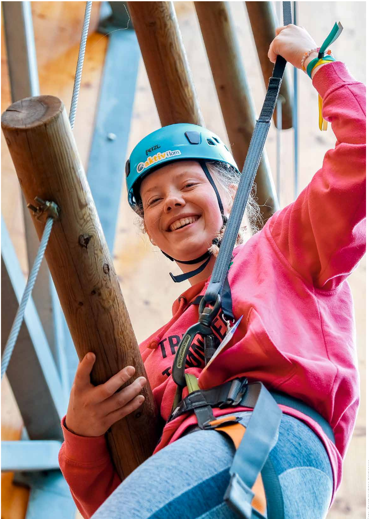
▲ 4H-arar opplevde meistring og nådde nye høyder i klatreveggen.