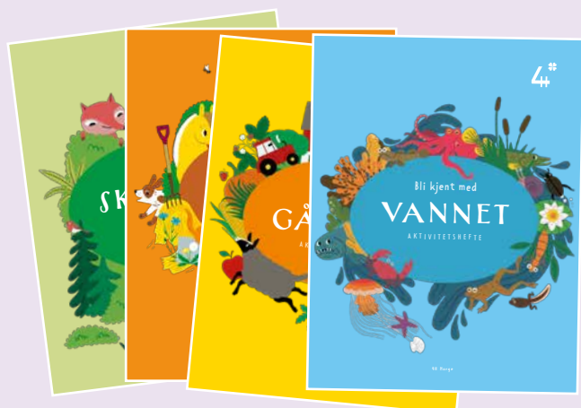
Aktivitetshefte for kløvermedlemmar (4–9 år).

For fjerde år på rad vart det laga eit aktivitetshefte, spesielt for våre yngste medlemmar (4–9 år); kløvermedlemmane. Heftet skal inspirere til og legge til rette for lek og læring i og med naturen, i tillegg til å skape kjennskap til eit emne, gjennom å skape nysgjerrigheit. Dette var fjerde av fem planlagde hefter. Temaet var vatn. Tidlegare har det vore gitt ut hefter om skogen, dyra og garden, medan planter er det gjenværande temaet.