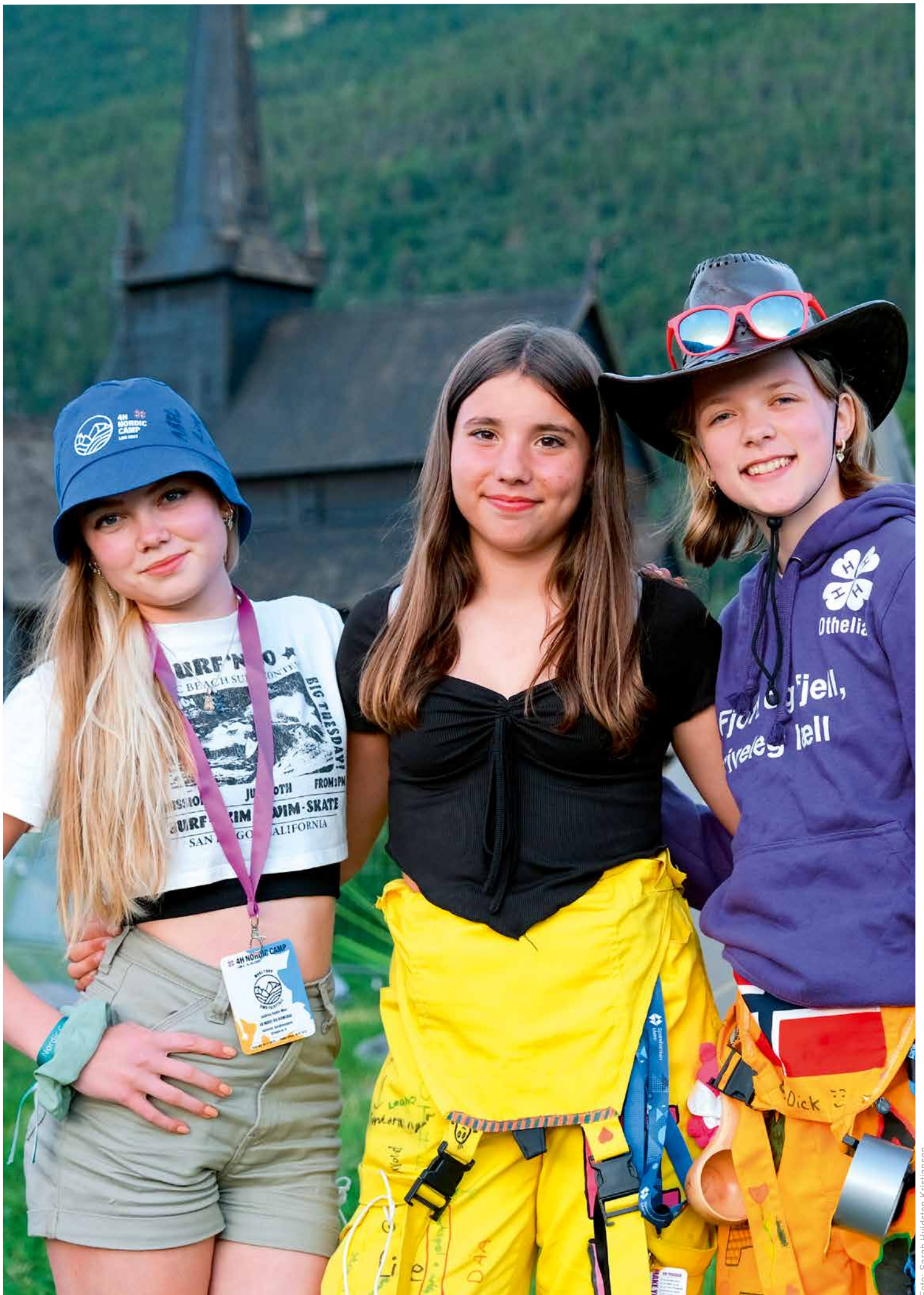
▲ 4H-arar på leircamp på Nordisk leir i Lom. (Lom stavkyrkje i bakgrunnen).