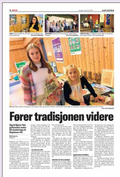
02.11.23 Bladet Vesterålen