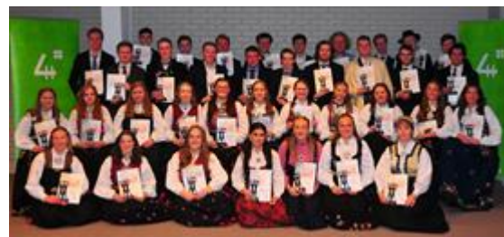
Plakettmottakerne i 2023