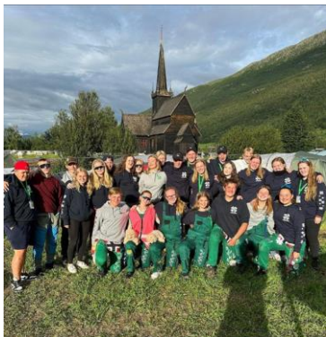
Buskerudgjengen under Nordisk leir i Lom