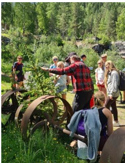
Skog- og Nesbyrebus under fylkesleiren i Nesbyen.

Fylkesstyret og BASE stilte også med stand og skognatursti på EM i Skogbruk på Kongsberg i juni og på åpningen av Langedrag som 4H gård i oktober.