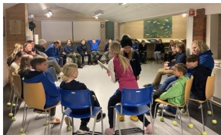
4H-møte i Hallingen 4H