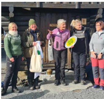
Offisielle åpning av Langedrag Naturpark som 4H-gård med utdeling av 4H-gårdsskiltet.

1.oktober hadde vi åpning av Langedrag Naturpark 4H-gård, og i den forbindelse hadde vi et flott arrangement som var åpent for alle og gratis inngang for 4H-ere. Her hadde vi konkurranser, natursti, spikking samt pinnebrød og s'mores på bål. Alle fikk også delta på omvisningen på gården, og eksklusivt for alle 4H-erne var at de fikk hilse på ulvevalpen Nare.