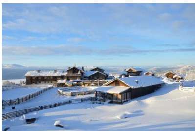
Langedrag Naturpark 4H-gård

1.oktober hadde vi åpning av Langedrag Naturpark 4H-gård, og i den forbindelse hadde vi et flott arrangement som var åpent for alle og gratis inngang for 4H-ere. Her hadde vi konkurranser, natursti, spikking samt pinnebrød og s'mores på bål. Alle fikk også delta på omvisningen på gården, og eksklusivt for alle 4H-erne var at de fikk hilse på ulvevalpen Nare.