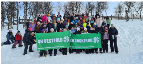
Deltakerne fra Vestfold og Buskerud på Villmarkshelgen på Langedrag