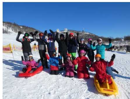
Akemøte i Samklang 4H