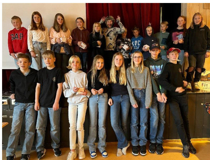
Høstfest i Rjupa 4H