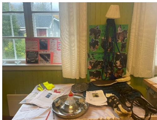
Utstilling av prosjekter på høstfest i Trenissen 4H