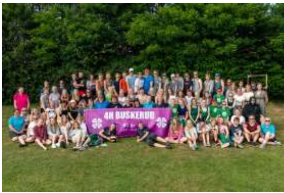
Buskerud-gjengen under landsleir 2019