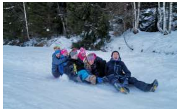
Akemøte i Furukvisten 4H

Årsmeldingene til klubbene viser stor aktivitet og det er et bredt spekter av aktiviteter som blir gjennomført i løpet av et 4H-år. Mange klubber er opptatt av fysisk aktivitet og legger mange av møtene sine utendørs i tillegg til faste volleyballtreninger. Det jobbes med rekruttering på lokalplan hele året, men vi må bli enda flinkere til å vise fram alle de gode aktivitetene 4H har å by på.