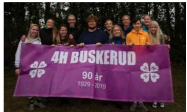
BASE under Landsleiren på Bornholm.