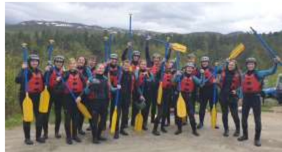
Deltakerne på Actionhelgen etter rafting ned Lågen