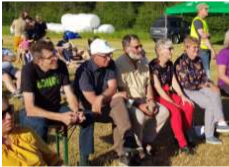
Noen av æresdiplom-mottakerne under 90-års jubileet.