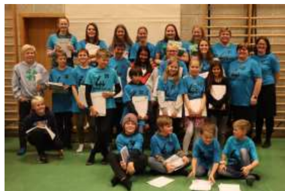
Høstfest i Samklang 4H