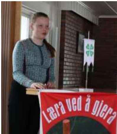
Deltakerne fra medlemskonferansen var flinke til å entre talerstolen under årsmøtet 2018

Arrangører: 4H Buskerud, BASE og Øvre Eiker 4H-nemd