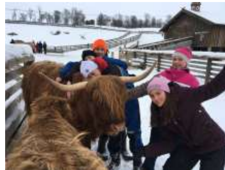
Dyrekos på Langedrag