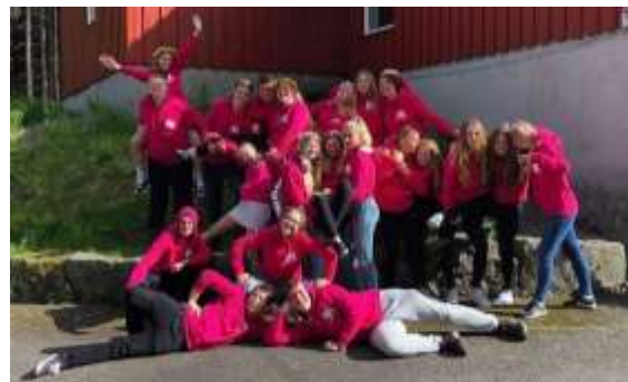
Trivselsagentene 2019 i BTV

4H Buskerud har i år hatt 5 trivselsagenter. De hadde sine samlinger sammen med Vestfold og Telemark, og i løpet av året hadde de 5 samlinger. I tillegg deltok de på Aspirantleir i Vestfold, Fylkesleir i Buskerud og på fellessamling under Nordisk leir