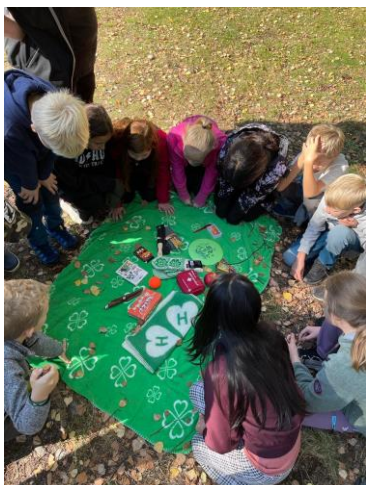
Aktivitetssmøte i Eikernøtta 4H