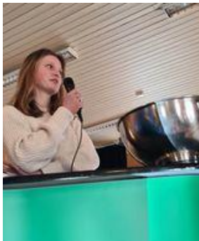
Vilje fra Simoa 4H, var en av de som sa sin mening under Generaldebatten

Årsmøtet ble avholdt den 25.mars på Torpo, samme helg som styreverv-kurset. Det var 37 stemmeberettigede og 28 observatører på årsmøtet. 17 av 29 klubber var representert. (Toso 4H er en av våre klubber, men de møtte i stede på årsmøte i 4H Oppland og brukte sin stemmerett der)