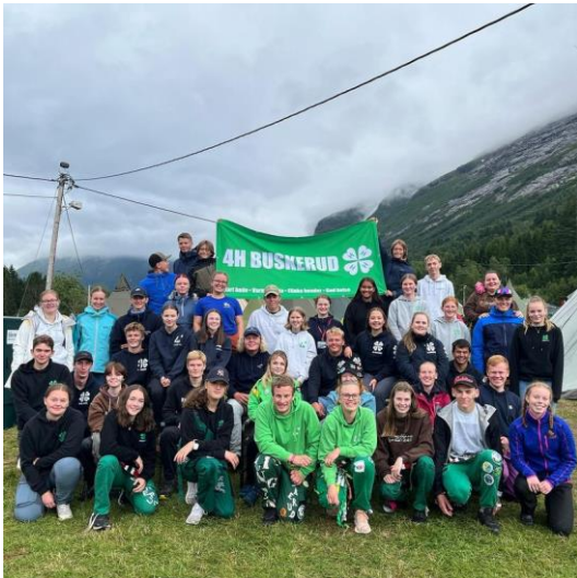
Buskerudgjengen under Landsleiren i Breim