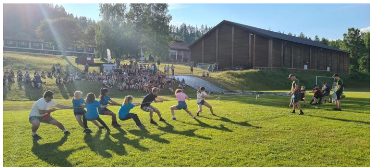
Fylkesmestersakp i tautrekking på Fylkesleiren