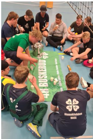
Timeoute under superfinalen

Arrangør: 4H-klubbene i Nedre Hallingdal