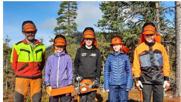
Motorsagkurs på Nesbyen i mai

4H Buskerud har i den forbindelse arrangerte 4 motorsagkurs og 2 motorryddesag/ungskogpleie-kurs med støtte fra disse midlene. Det var plass til 6 deltakere pr. kurs og 29 medlemmer deltok. Det var instruktører fra Aktivt Skogbruk som holdt kurset for oss.