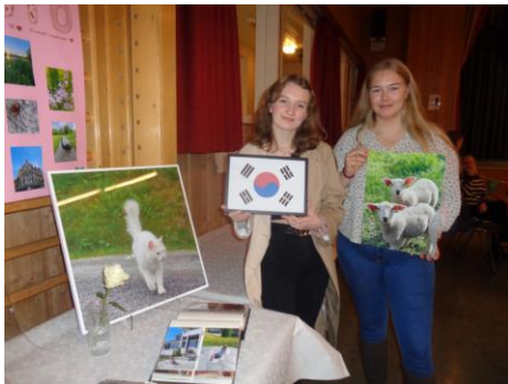
Høstfest i Rose 4H