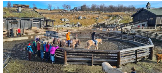
Voltige på Langedrag