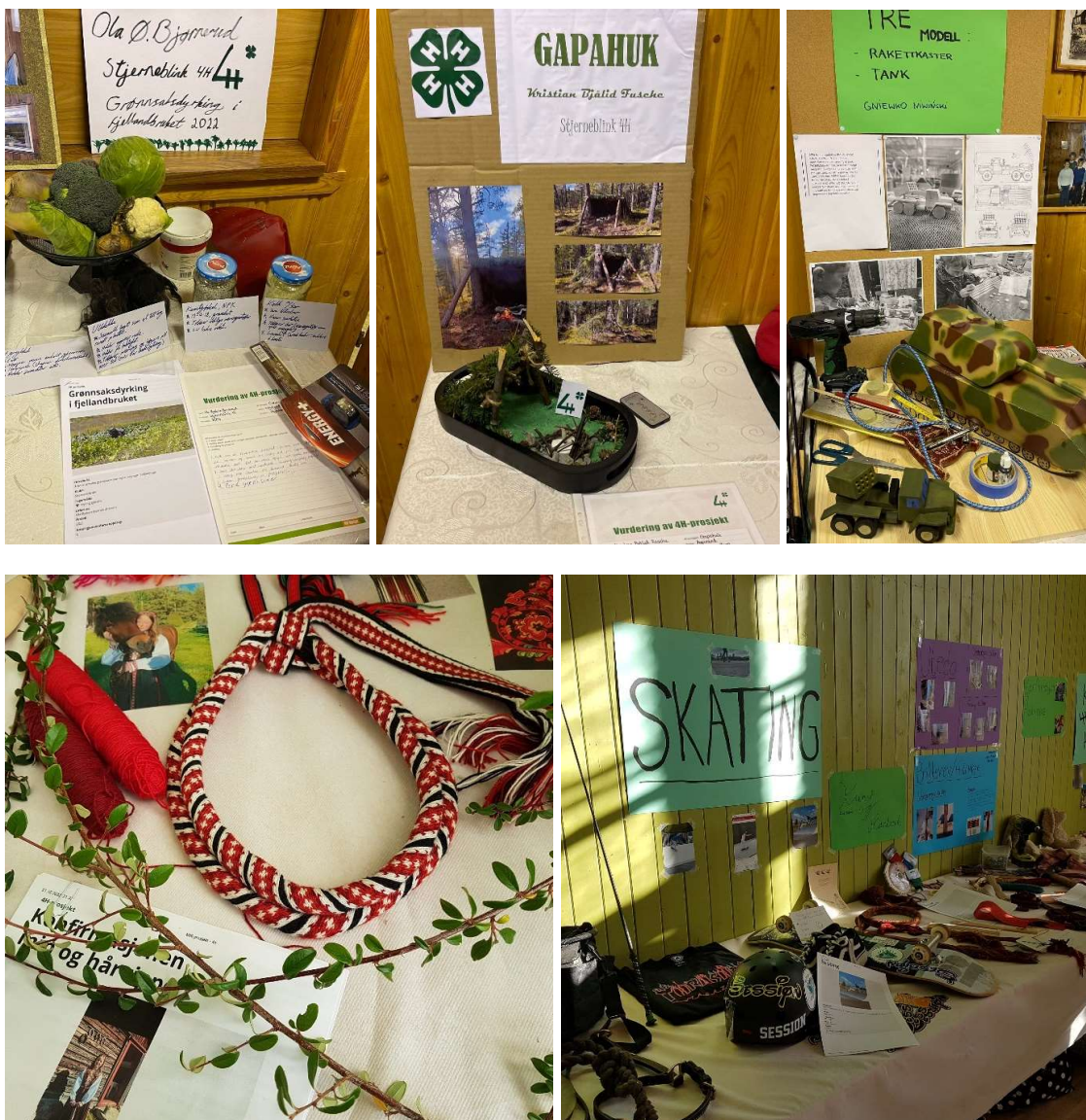
Bilder fra høstfest i Stjerneblink 4H, Fjellrosa 4H og Trenissen 4H