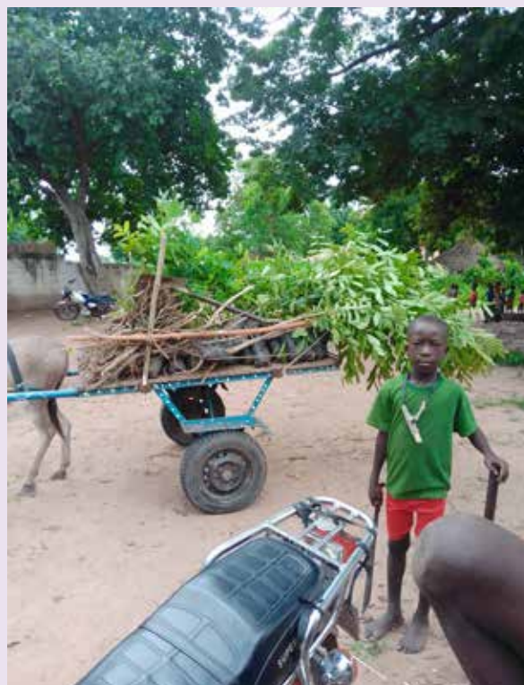
▲ 4H GAMBIA: Planteskule med produksjon av småplanter i hagen til 4H-kontoret.

Den planlagde studieturen til Gambia i februar vart avlyst grunna korona. Av same årsak vart det heller ikkje noko av det årlege prosjektbesøket frå Noreg til Gambia i november.