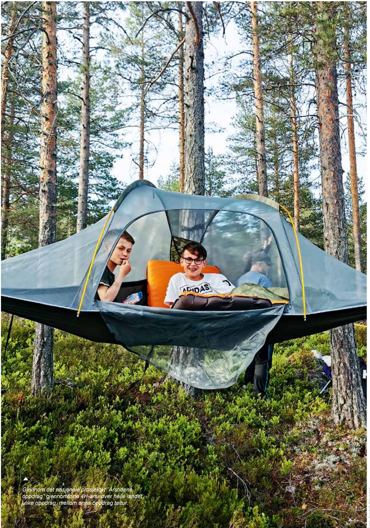
▲ Gjennom det nasjonale prosjektet "Arstidens oppdrag" gjennomførte 4H-arar over heile landet ulike oppdrag, mellom anna oppdrag teltur.