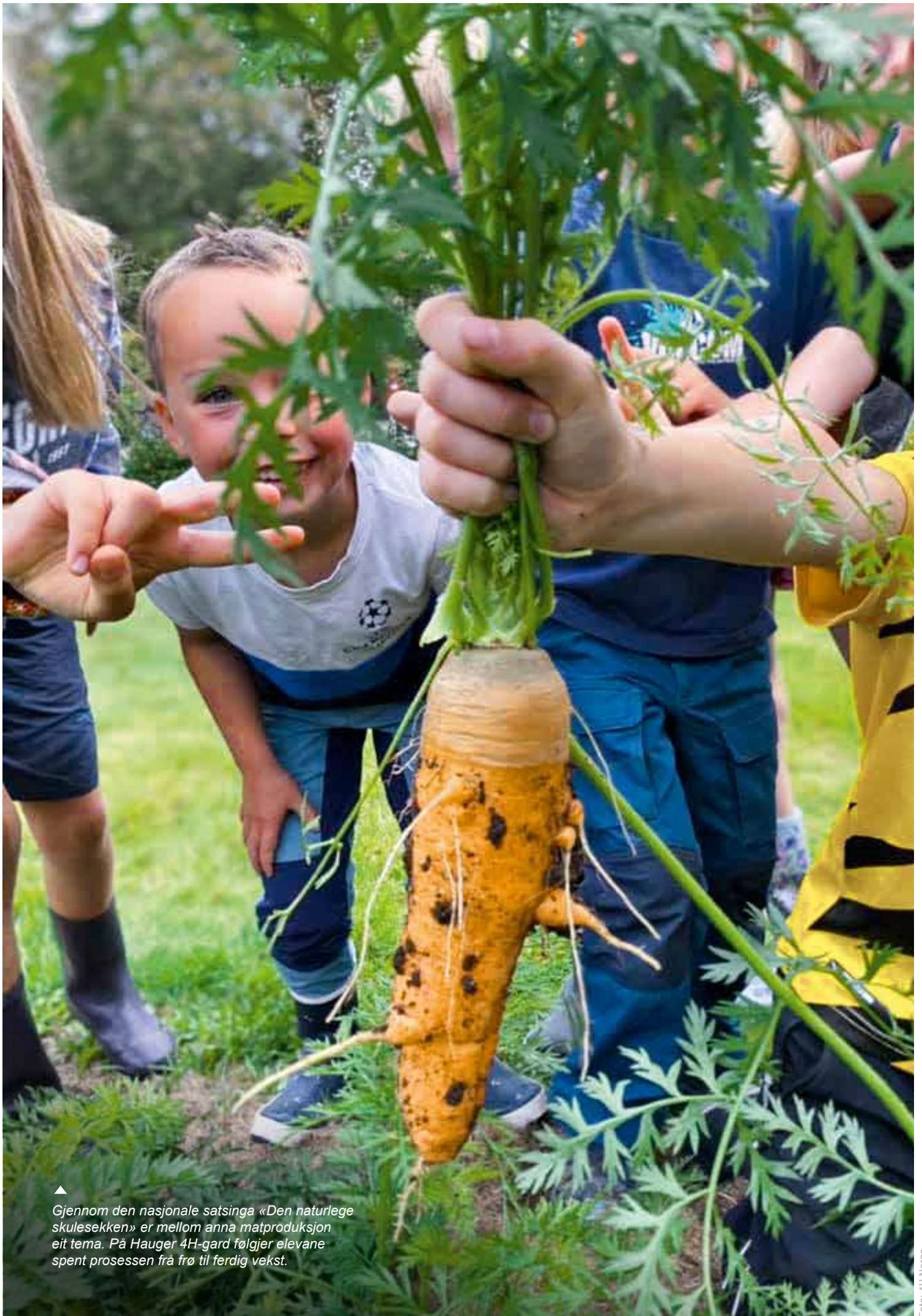
▲ Gjennom den nasjonale satsinga «Den naturlege skulesekken» er mellom anna matproduksjon eit tema. På Hauger 4H-gard følgjer elevane spent prosessen frå frø til ferdig vekst.