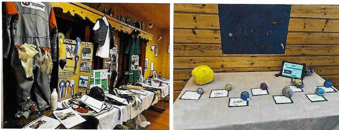
Bilder fra høstfest i Stjerneblink 4H, Fjellrosa 4H og Lisleherad 4H

De siste årene har fylkesstyret besøkt de 4H-klubbene som har ønsket besøk på høstfestene. Og fylkesstyret har under årets høstfester latt seg imponere av mange flotte og kreative prosjekter.