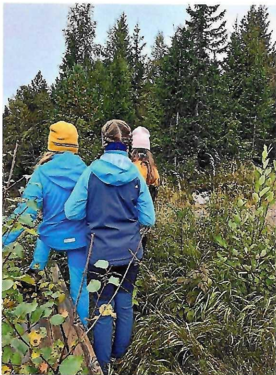
Venter på haren.

I oktober arrangerte Rjupa 4H aktiviteter for nye og gamle medlemmer. De nye medlemmene tovet sitteunderlag, men de andre medlemmene laget fuglekasser som de skal henge ut til våren når småfuglene trekker hjem igjen!